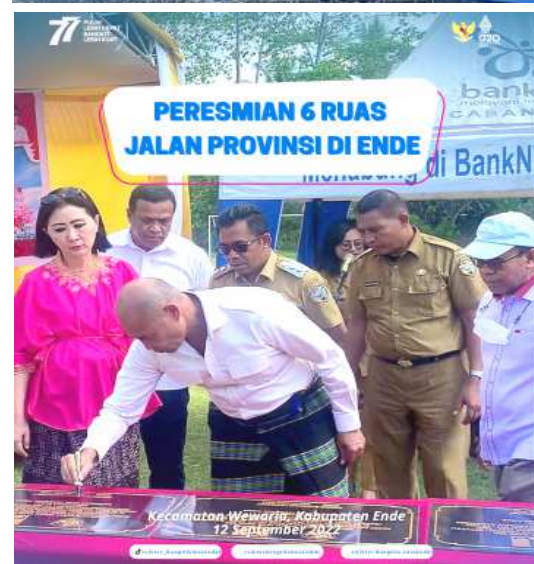
PERESMIAN 6 RUAS JALAN PROVINSI DI ENDE