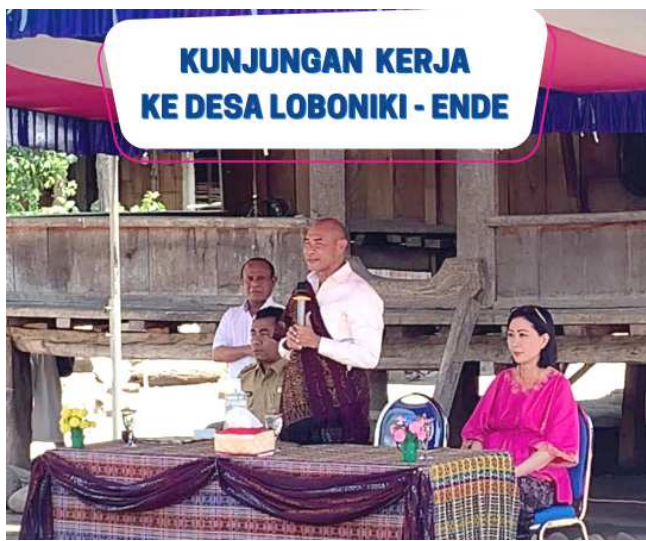
KUNJUNGAN KERJA KE DESA LOBONIKI - ENDE