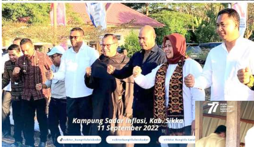
Kampung Sadar Inflasi, Kab. Sikka 11 September 2022