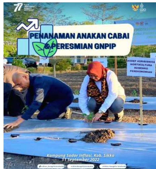
PENANAMAN ANAKAN CABAI & PERESMIAN GNPIP